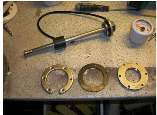
Her ses wema's tank måler. Med en u-bøjle som monteres indvendig i tanken og en flange udvendig som måleren skrues ned i. Måleren er 250 mm lang.

Der bores et 43 mm hul til flange og 6 stk 5 mm til skruer. Sørg for at måle de 6 huller til skruer helt nøjagtig op! Tanken kan nu også lige checkes for evt diesel pest. Dernæst placeres den u-formet bøjle inden i tanken, pakning og flange udvendig og det hele skrues sammen. Smør evt lidt flydende pakning over og under gummipakningen. (anbefaling jeg fik, men jeg ved ikke om det er nødvendig) Når det er gjort kan sensoren monteres ved blot at skruer den fast i flangen.