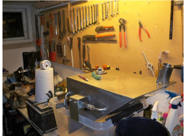
Prøve montering og måling af tank.