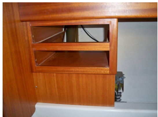
Der er ikke meget plads at arbejde på til at få påfyldningsslangen af. Adgang fra siden var også umulig.